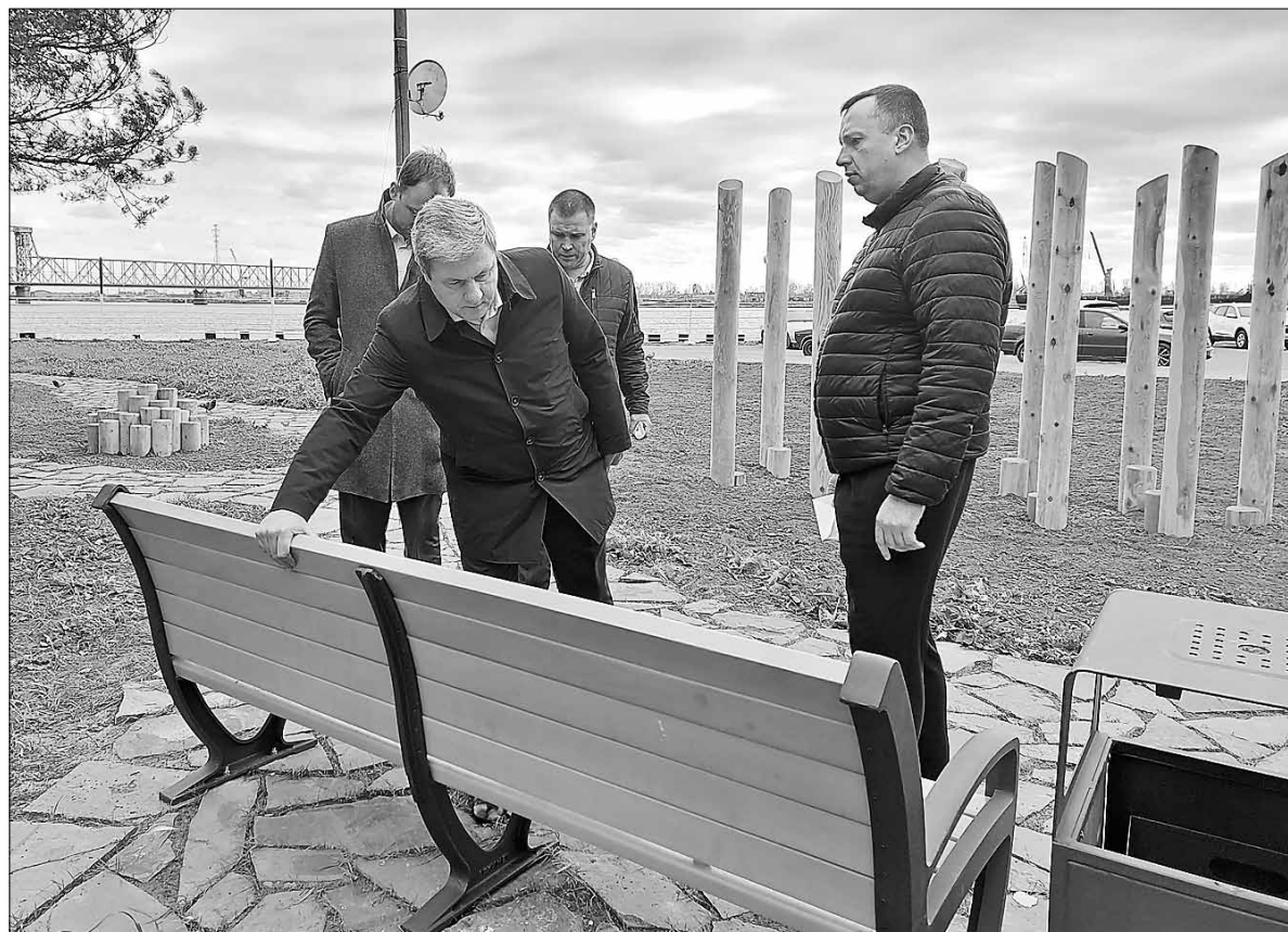
■ Сквер «Добро» в экостиле – уже шестая территория отдыха в Архангельске, созданная муниципальным предприятием «Городское благоустройство»

«Архкомхоз» в ту пору занимался уборкой дорог и тротуаров, обслуживанием мостов и прочисткой ливневой канализации. Грамотные управленческие решения постепенно улучшали дела на предприятии, да и сам Кузнецов не сбежал с должности ни через месяц, ни даже спустя пару лет.