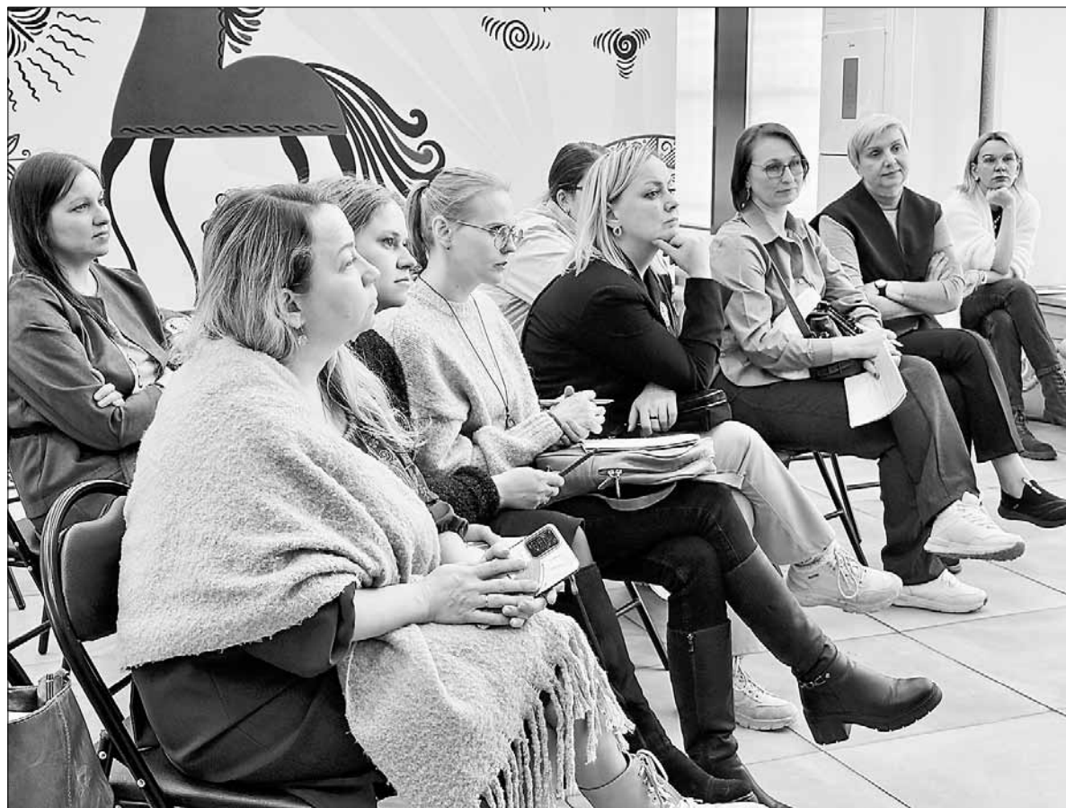
■ Участники проекта «Опора».

– Этот проект – давняя моя любовь, ведь я сама являюсь специалистом по работе с подростками. Он называется «Взрослеем вместе», потому что родители часто сами взрослеют вместе с детьми. Мы им в этом помогаем. Впервые, создали сайт для взрослых о подростках, где есть материалы, созданные в рамках проекта «Опора», и родители могут посмотреть видеуроки. Они посвящены психофизиологии подростков, возрастным особенностям, тому, как формируются отношения в семье. Есть темы и про гаджеты, и про буллинг, и про суицид: как привлечь внимание, увидеть первые звоночки эмоционального неблагополучия своих детей.