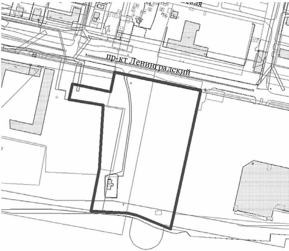
СХЕМА границ проектирования

ПРИЛОЖЕНИЕ № 2 к заданию о подготовке проекта внесения изменений в проект планировки района «Майская горка» муниципального образования «Город Архангельск» в границах части элемента планировочной структуры: просп. Ленинградский площадью 2,8766 га