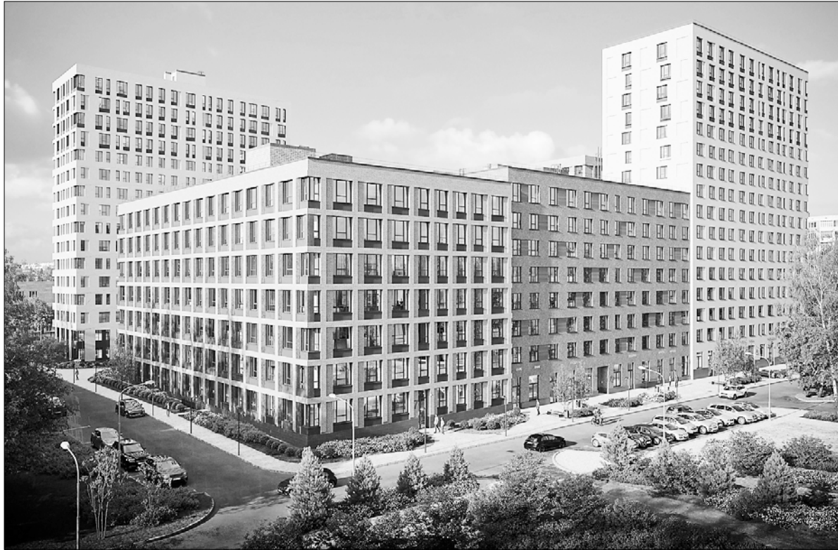
Реклама. Застройщик ООО СЗ «ГАЛАКТИКА». Проектная декларация – на сайте наш.дом.рф

Строительство первой очереди началось в 2023 году. Сейчас на первом корпусе завершаются отделочные работы и монтаж лифтов. Его сдача в эксплуатацию состоится в этом году. На втором корпусе завершаются работы на кровле. На третьем корпусе, продажи квартир в котором стартуют 3 марта, выполнено устройство фундамента.