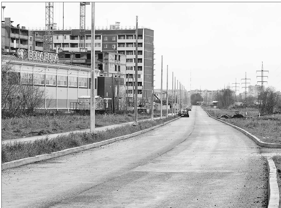
■ Строительство дороги на улице Карпогорской

Кроме того, продолжалось масштабное строительство на улице Карпогорской. Напомним, здесь дорожники прокладывают новый участок автодороги от улицы Октябрья до проспекта Московского. Стоимость строительства – 870 миллионов рублей. Этот значимый для Архангельска проект стал возможен благодаря личному участию губернатора Поморья Александра Цыбульского . По его поручению региональное правительство направило средства на развитие областного центра. По информации департамента транспорта, строительства и городской инфраструктуры администрации Архангельска, в 2025 году здесь были выполнены строительно-монтажные работы на сумму 779,2 миллиона рублей, а общая строительная готовность по контракту составила 95 процентов. Ввод объекта в эксплуатацию запланирован на 2026 год.