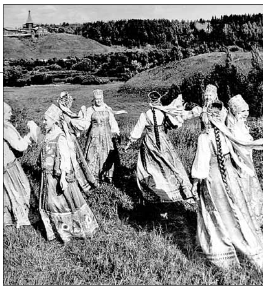
■ 1985 год