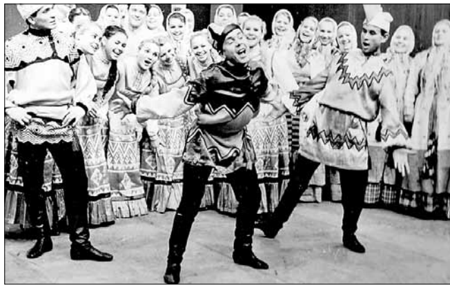
■ Постановка «Идут, идут-то скоморохи». 1966 год