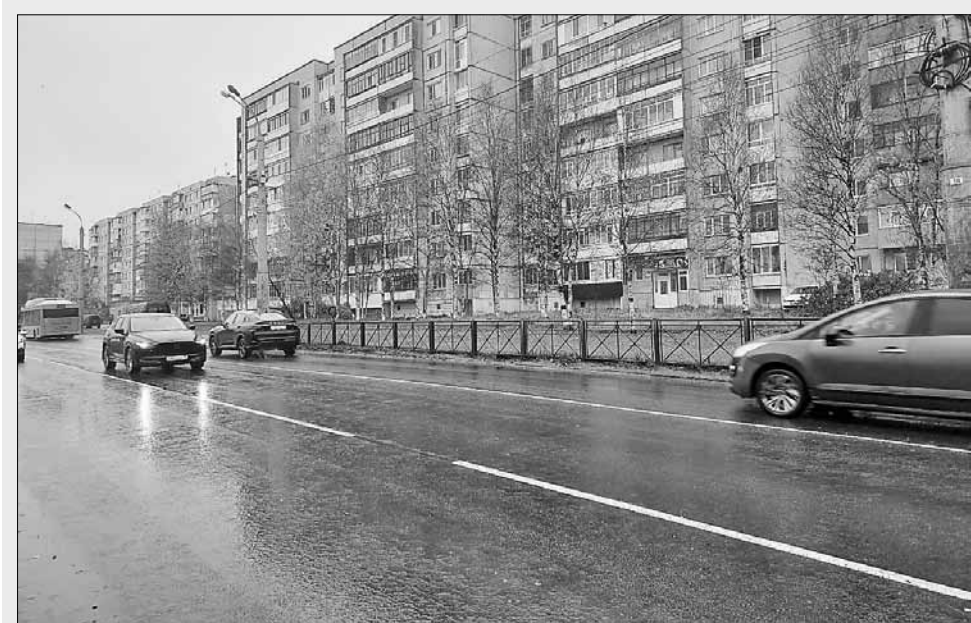
■ Отремонтированная автодорога на улице Советской