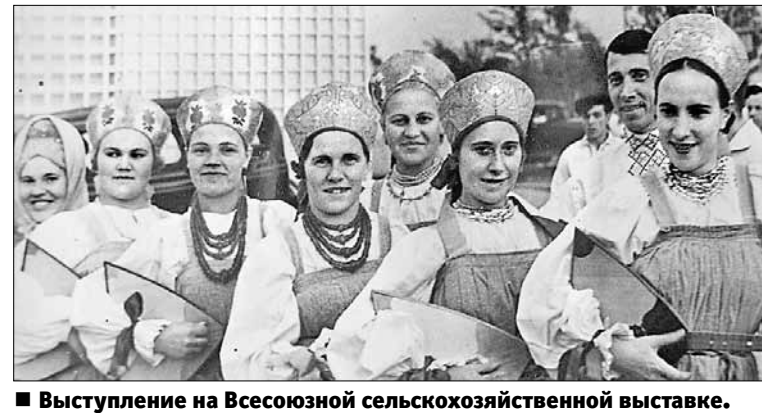
■ Выступление на Всесоюзной сельскохозяйственной выставке. 1939 год