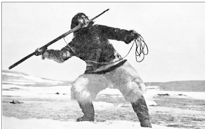
■ Кадр из документального фильма 1922 года «Нанук с Севера» режиссера Роберта Флаэрти

«Сплоченные морозом». Ее программа – это многогранное исследование Арктики через разные виды искусства и живое общение.