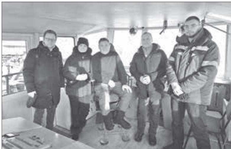
■ В капитанской рубке

Буксир «Энтузиаст» Юрий Викторович осматривал не спеша, с большим вниманием к каждой детали. Во время визита он рассказал, что нашел и прочел монографию, посвященную буксиру-фрон-