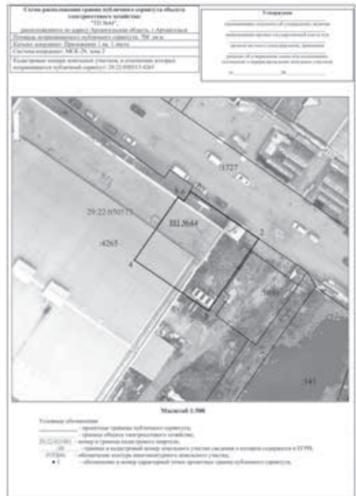
Каталог координат границ публичного сервитута объекта электросетевого хозяйства «ТП-44»

Графическое описание местоположения границ публичных сервитутов с указанием координат характерных точек границ публичного сервитута: