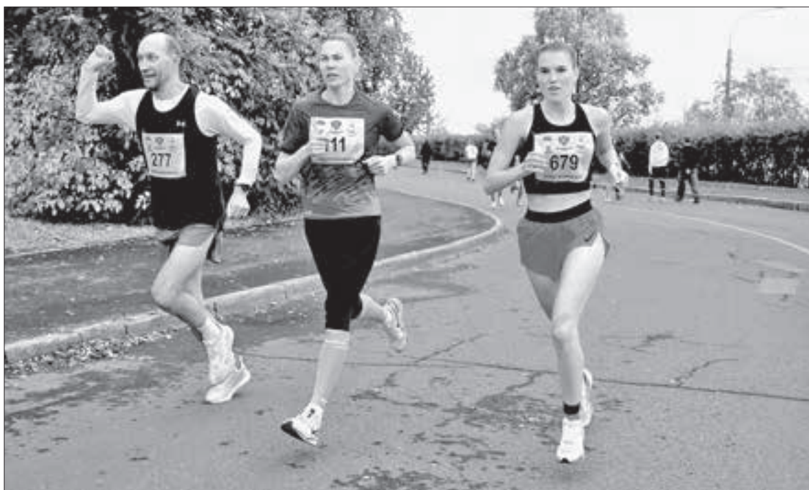
■ «Кросс нации»

Министр спорта обозначил цели на 2026 год. Так, в рамках госпрограммы «Развитие физической культуры и спорта» планируется завершить создание модульных универсальных спортивных залов в Коноше и Карпогорах, а также 25-метрового плавательного бассейна в Каргополе. Новые модульные залы единоборств появятся в Новодвинске и Котласе. Три многофункциональные спортивные площадки будут построены в Мирном, Новодвинске и Ленском районе.