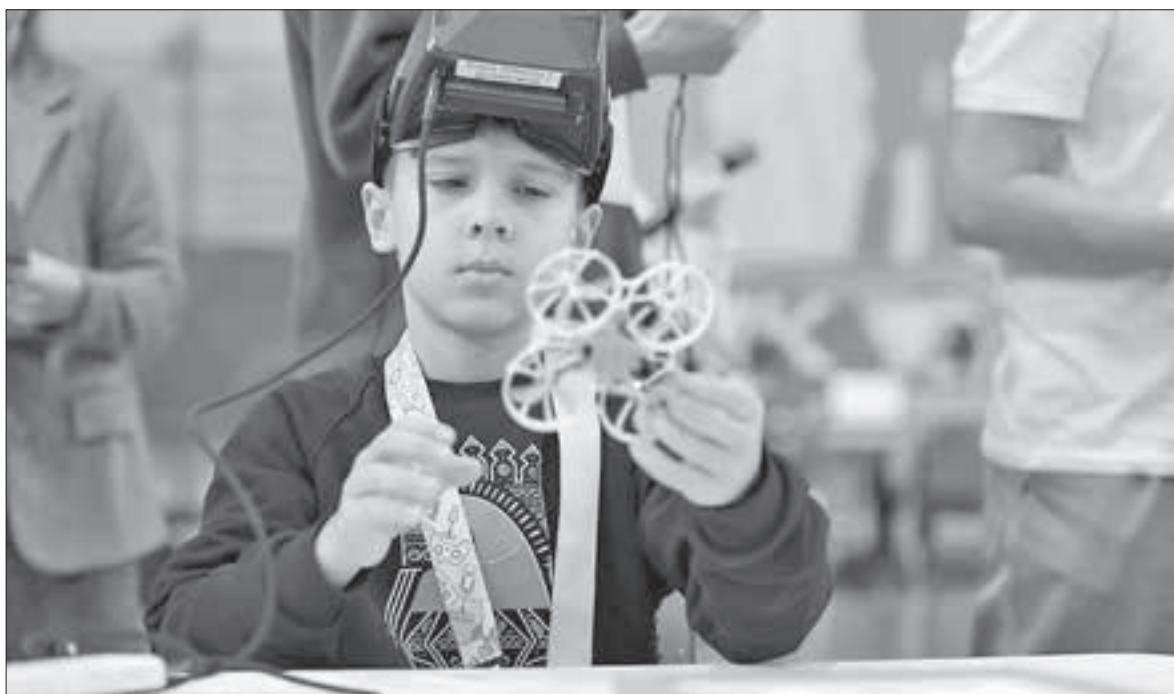
■ Гонки дронов