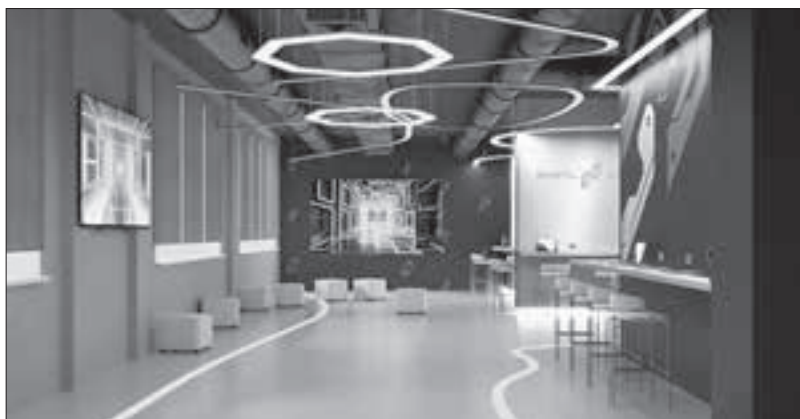
■ Фиджитал-центр в школе № 7