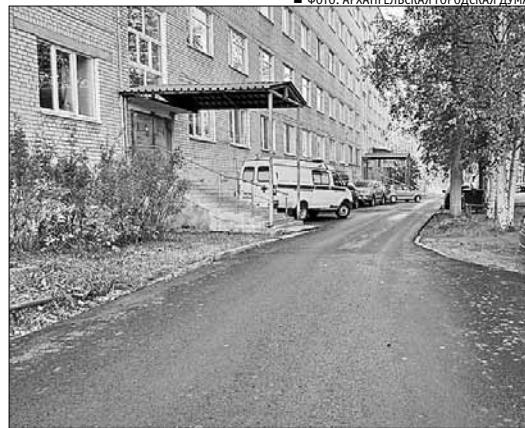
■ ФОТО: АРХАНГЕЛЬСКАЯ ГОРОДСКАЯ ДУМА