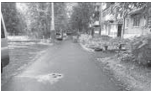
Комиссия признала объект одним из лучших в нынешнем году.