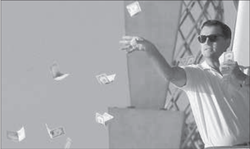
■ Кадр из фильма «Волк с Уолл-стрит»

Неприятно представлять просрочку, коллекторов, суды и продажу