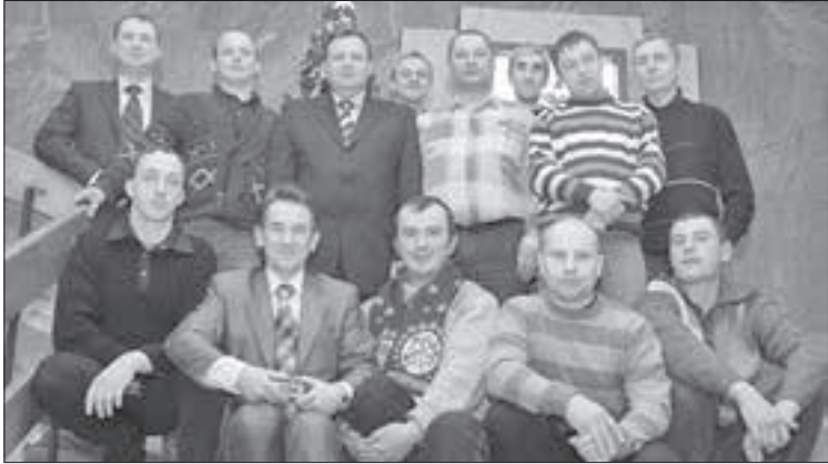
■ В 2009 году стояли жуткие морозы, но коллектив «Горсвета» монтировал новогоднюю елку, чтобы у горожан был праздник. Фото сделано по окончании работ

За три десятилетия предприятие выросло колоссально: с четырех единиц транспорта до более чем двадцати, а число сотрудников увеличилось с 50 до 82 человек. Но главное – изменился сам город.