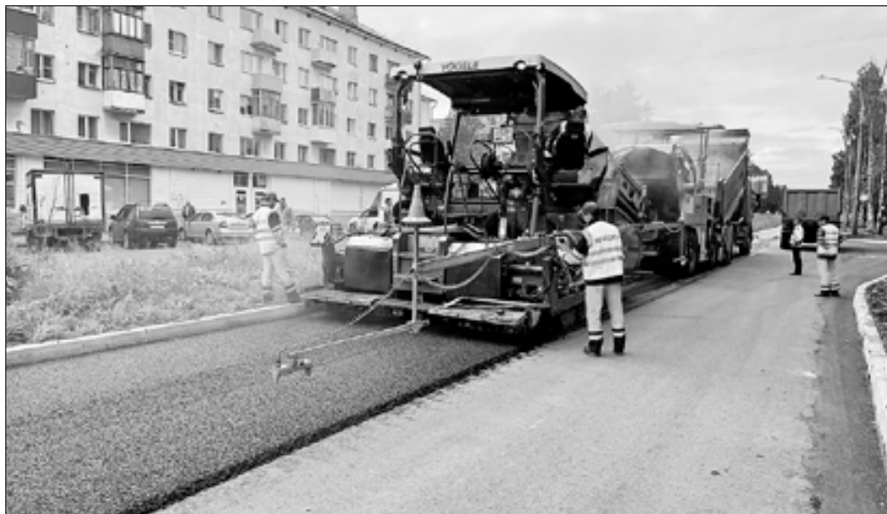
■ Проспект Ломоносова – самый крупный объект БКД в Архангельске

Участок улицы Шубина от набережной Северной Двины до Троицкого проспекта приводится в нормативное состояние, на модернизацию выделено свыше шести миллионов рублей.