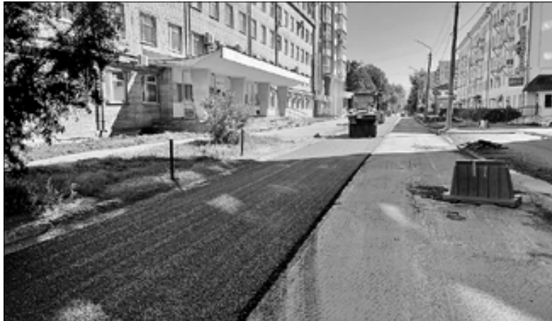
■ Укладка финишного слоя на улице Попова

выполнены почти на 80%. Причем на участке от Гагарина до Карла Маркса работают сотрудники компании «Автодороги», а отрезок до улицы Урицкого взял на себя «Помордорстрой».