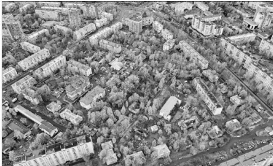
■ Участок в районе ул. Логинова – ул. Г. Суфтина – ул. Попова – пр. Обводный канал