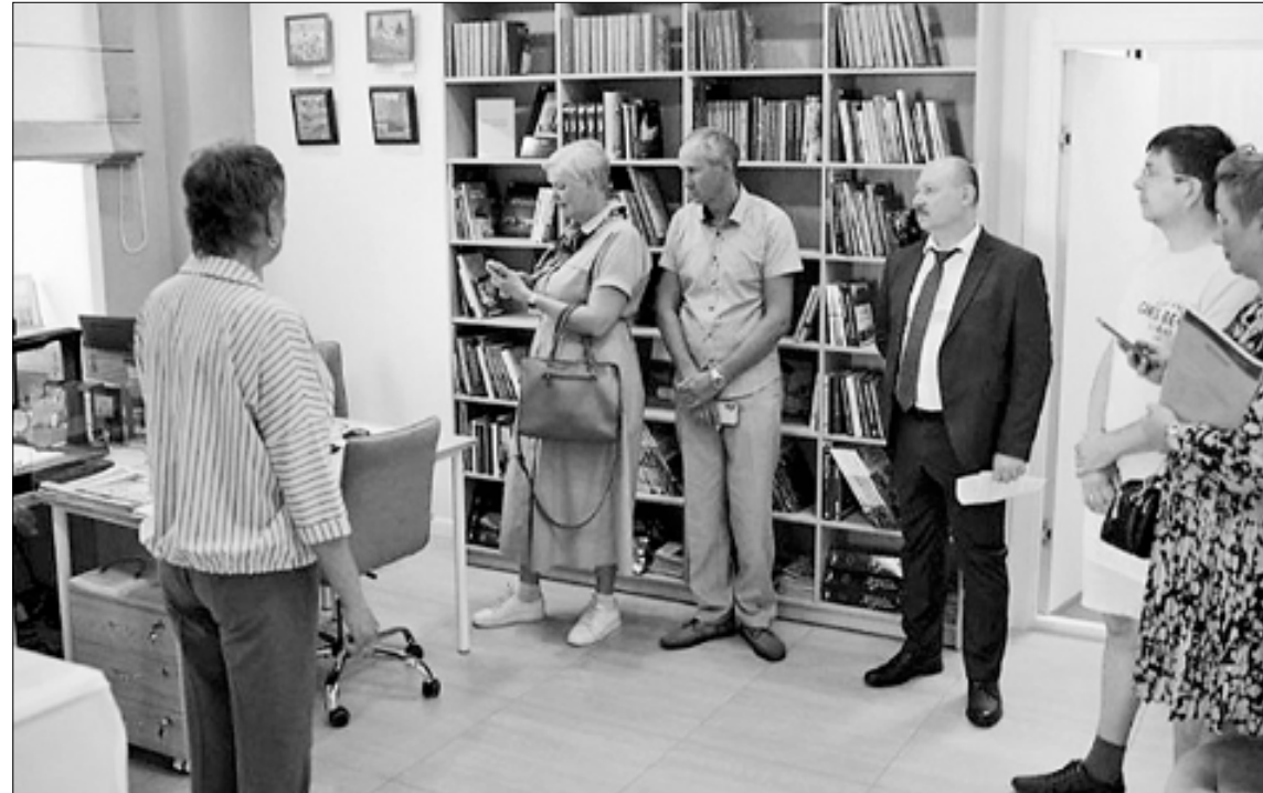
■ ПРЕСС-СЛУЖБА ГУБЕРНАТОРА И ПРАВИТЕЛЬСТВА ОБЛАСТИ

Злоумышленники, обзавидавшиеся гражданам, постоянно совершенствуют свои методы, используют скрипты, написанные опытными психологами и социологами. Это значительно увеличивает вероятность попадания человека на такие уловки. Поэтому расслабляться ни в коем случае нельзя – нет закона или другого волшебного средства, которые разом обезопасят граждан от мошенников. Нужна постоянная комплексная работа и, главное, бдительность самих людей.