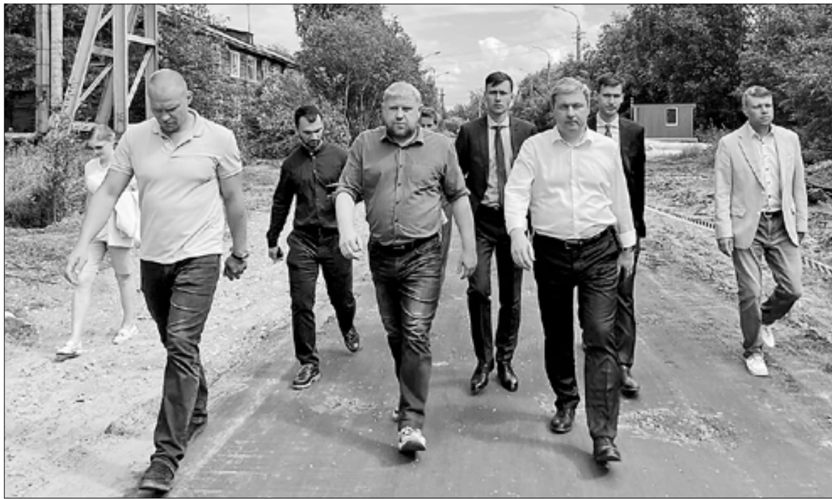
■ Контрольная поездка на улицу Красных Партизан в Соломбале

На данный момент подрядчик полностью выполнил фрезерование, демонтировал бортовой камень и локи колодцев, уложил выравнивающий слой. Продолжается устройство верхнего покрытия из щебеночно-мастичного асфальтобетона и заливка монолитного бортового камня. В целом работы по контракту