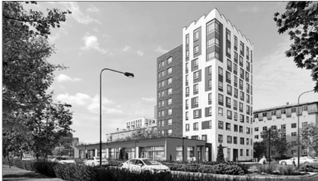
■ Предварительная концепция участка в районе ул. Комсомольской – ул. Карельской