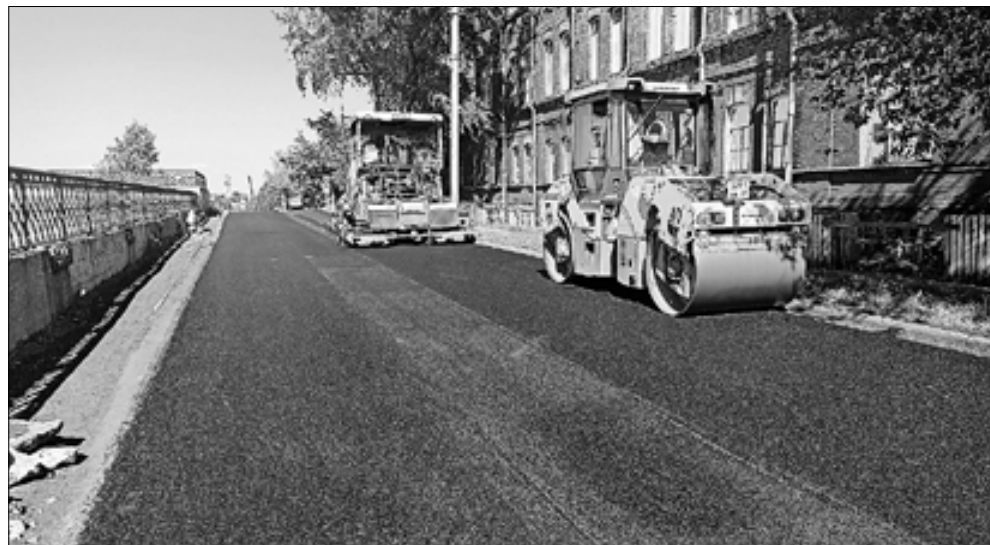
■ На набережной Северной Двины укладка асфальта началась в районе Архангельского ЛВЗ